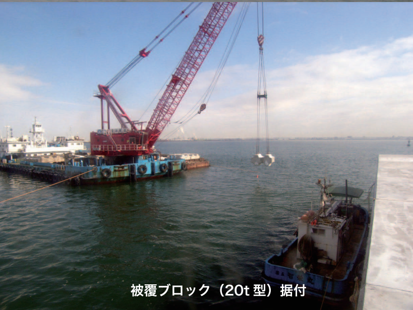
被覆ブロック (20t 型) 据付