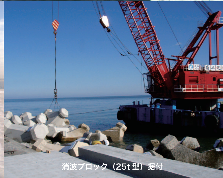
消波ブロック (25t 型) 据付