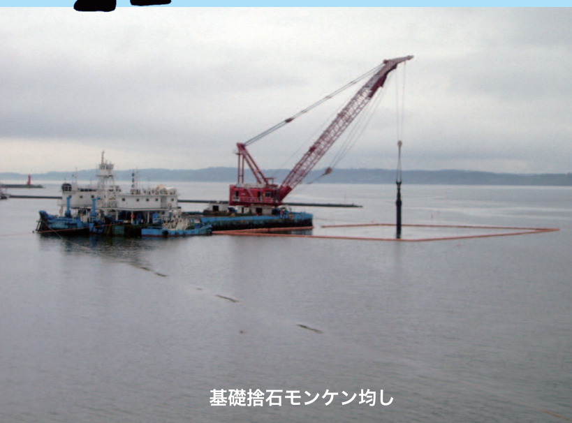
基礎捨石モンケン均し